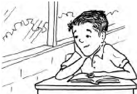
Jaime estaba soñando despierto.