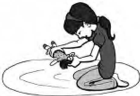
Emilia rompió su muñeca a propósito.